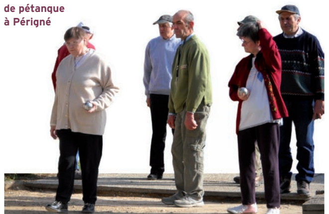
Joueurs de pétanque à Périgné

Nous sommes cependant confrontés à deux difficultés importantes liées à la non médicalisation de l'établissement, la question du coût du transport des résidents lors des différentes visites chez les professionnels médicaux et paramédicaux et la relative absence de lien et de coordination avec le médecin traitant et les différents spécialistes. La question de la médicalisation peut donc, dans certains cas, se poser. Nous avons ainsi intégré dans le processus de mise en place d'un GCSMS (groupement de coopération sociale et médico-sociale) les 4 PUV (petites unités de vie) que je dirige, ainsi que 8 Ehpad (établissement d'hébergement pour personnes âgées dépendantes). Nous avons conventionné avec les Ehpad pour faciliter la réorientation des résidents quand cela est nécessaire, c'est-à-dire quand les soins techniques sont trop lourds pour être mis en place à la Marpahvie ou quand le résident souffre de troubles de la déambulation.