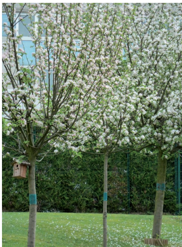
Le jardin du FAM au printemps

poste sont diplômés, y compris les aides médico-psychologiques et les aides-soignants. En cas de nécessité, l'établissement fait appel au secteur sanitaire. Toutefois, un séjour à l'hôpital peut s'avérer traumatisant pour un résident habitué à être choyé au FAM. Le directeur de l'établissement regrette de ne pas être parvenu à mettre en place de partenariat avec les hôpitaux parisiens : « Lorsqu'on leur envoie un résident, on leur adresse des informations très détaillées mais ils finissent toujours par nous appeler sans avoir ouvert le dossier. »